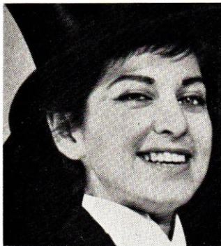
EKSTRÖM MANQUINA tel. 21 34 38