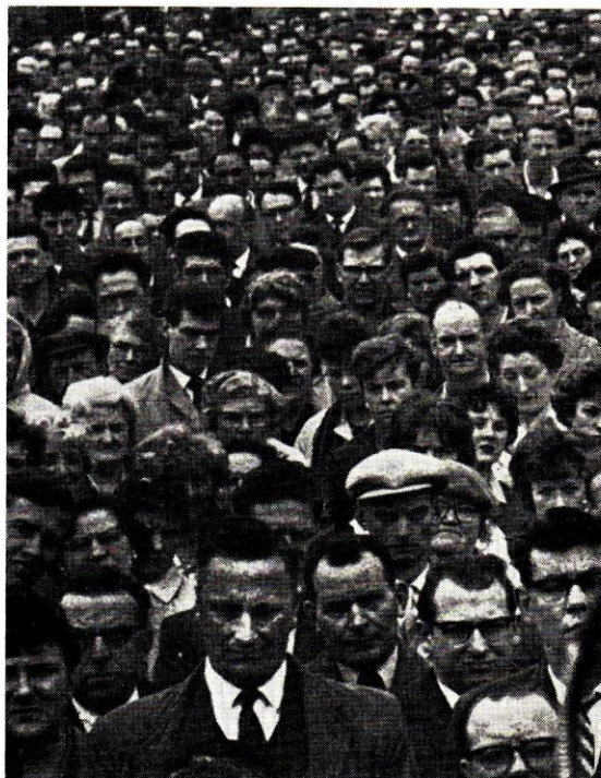
Publikbild från 1953

Turné 9.5. 1957—16.9. 1957 (Norrköping — Linköping — Vimmerby — Nässjö — Vetlanda — Kalmar — Karlskrona — Växjö — Borås — Vänersborg — Uddevalla — Göteborg — Trollhättan — Arvika —