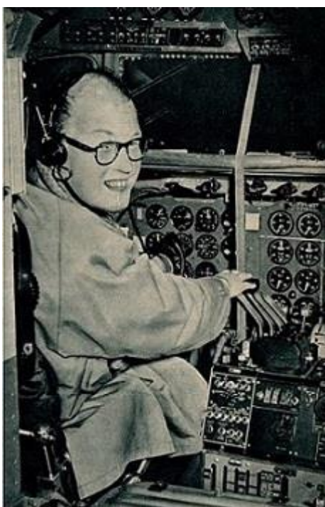
Titta jag flyger kom till 1951, och den lilla käcka reseberättelsen håller jag nog för att vara en av mina allra bästa genom åren. Att jag själv provat på flygarens vindomsusade yrke vill denna bild vara ett komplett vittnesbörd om.